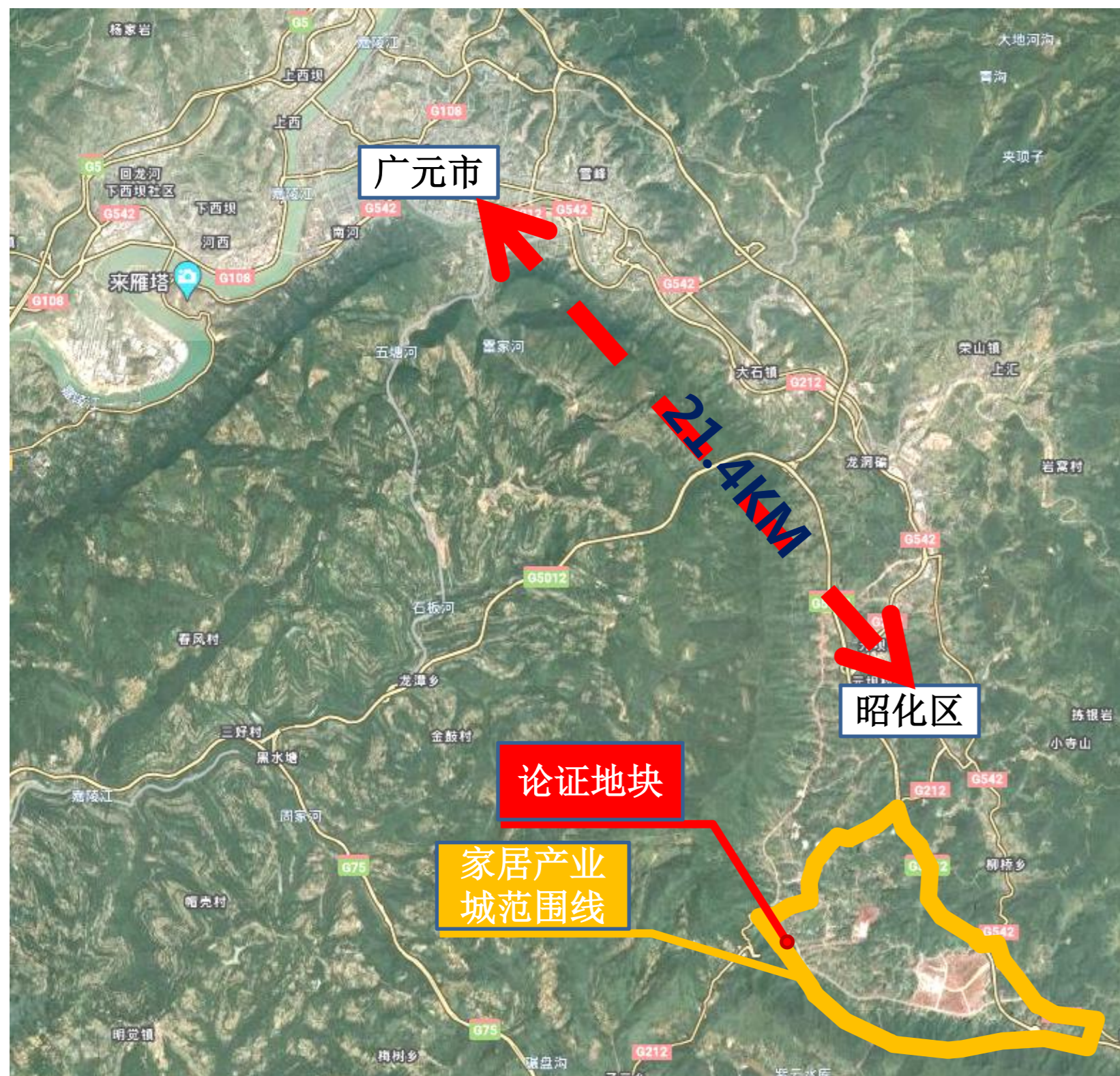
拟调整地块区位图