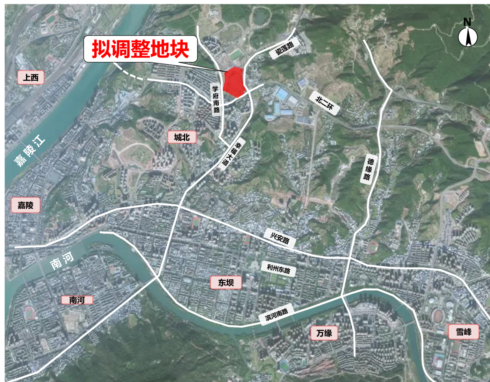
拟调整地块区位示意图

本次调整地块用地性质为城镇住宅用地，现根据《城市居住区规划设计标准（GB50180-2018）》《广元市规划管理技术规定（2024版）》《广元市国土空间总体规划（2021-2035年）》等相关技术规范及上位规划，综合地块周边已建项目及地块远期开发利用，对其容积率、建筑限高、建筑密度、绿地率等用地规划指标进行合理性论证。