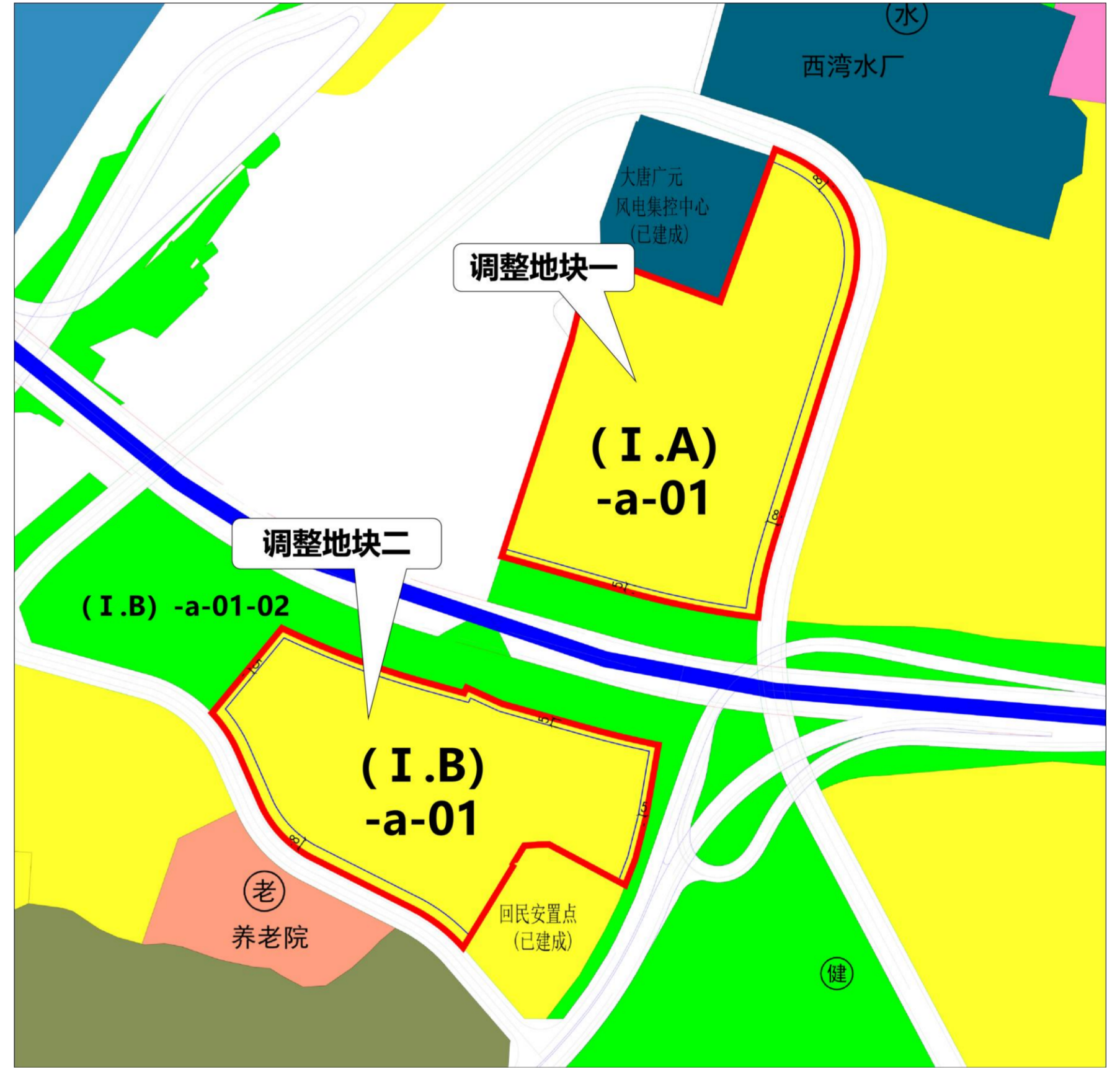
调整后用地规划布局图及指标表