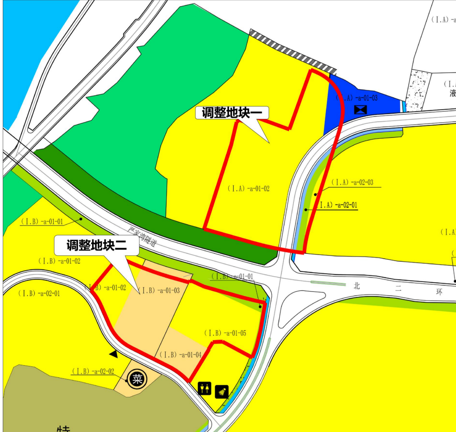
调整前用地规划布局图及指标表