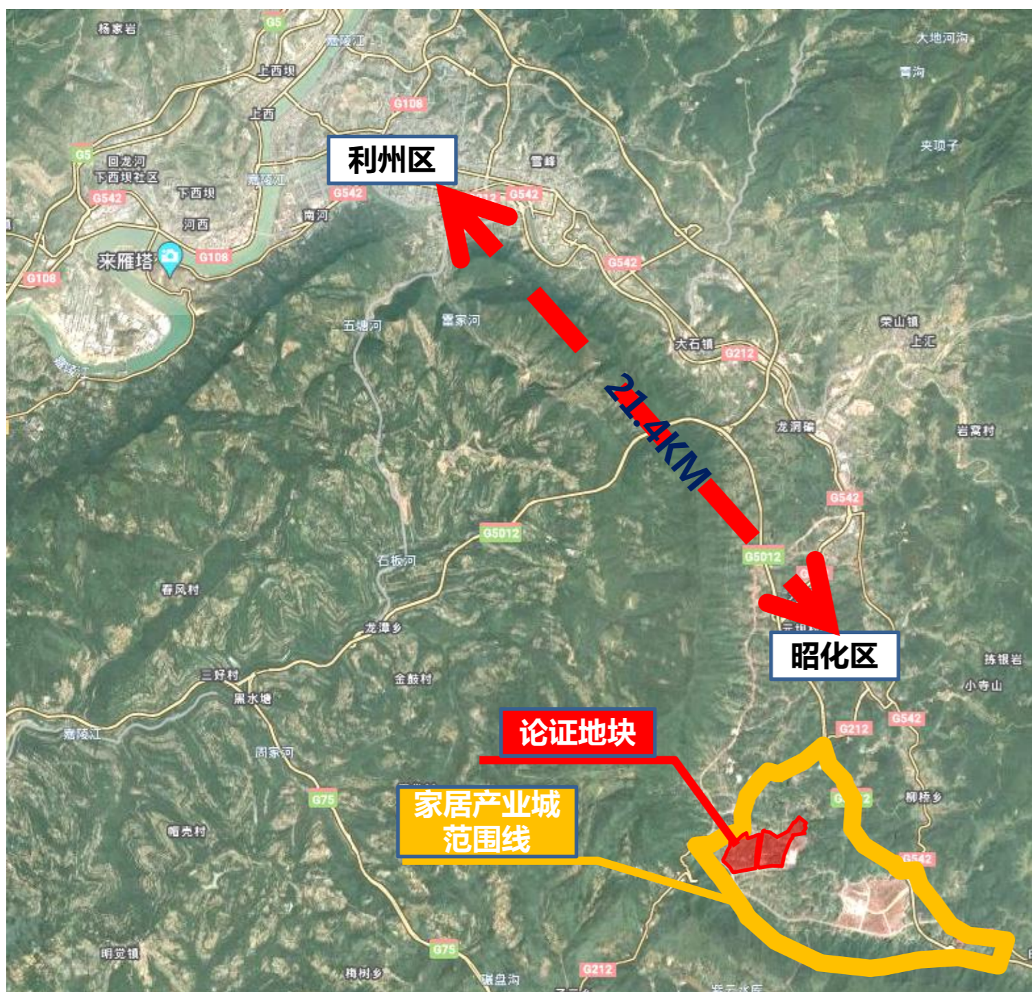
拟调整地块区位图