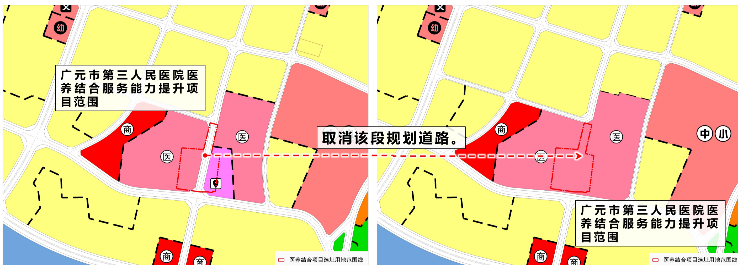
调整前用地布局图