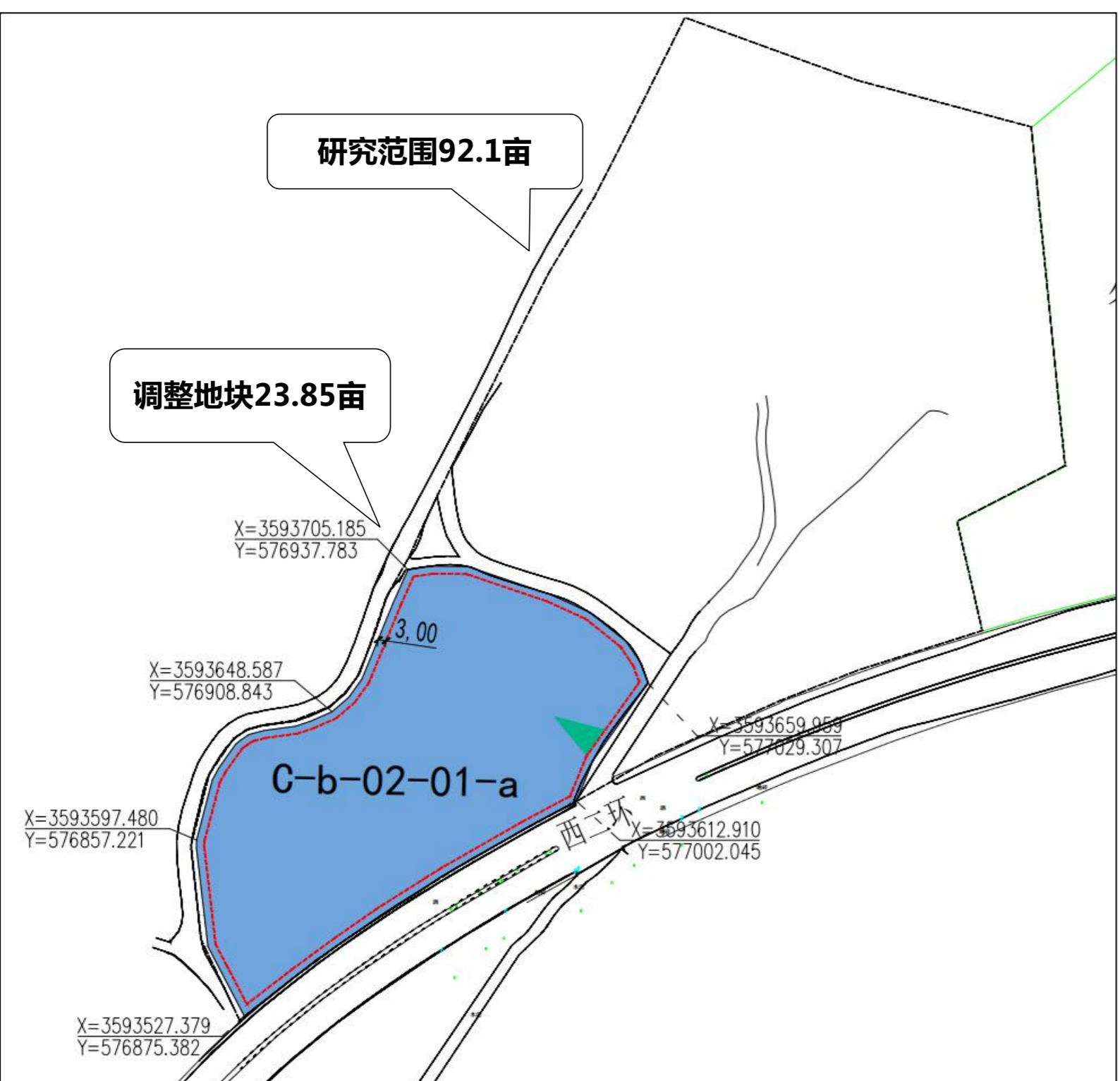
调整后用地布局规划图