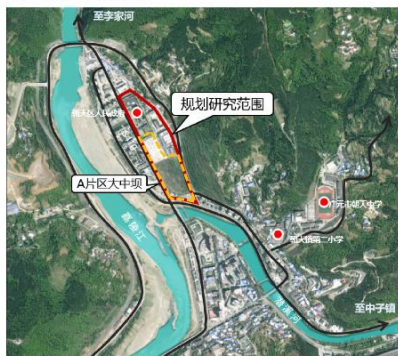
调整地块区位关系图