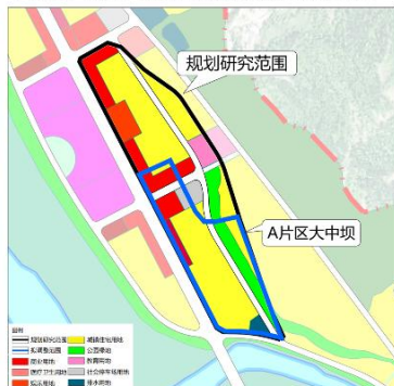
与《朝天区城市控制性详细规划》用地布局套合图