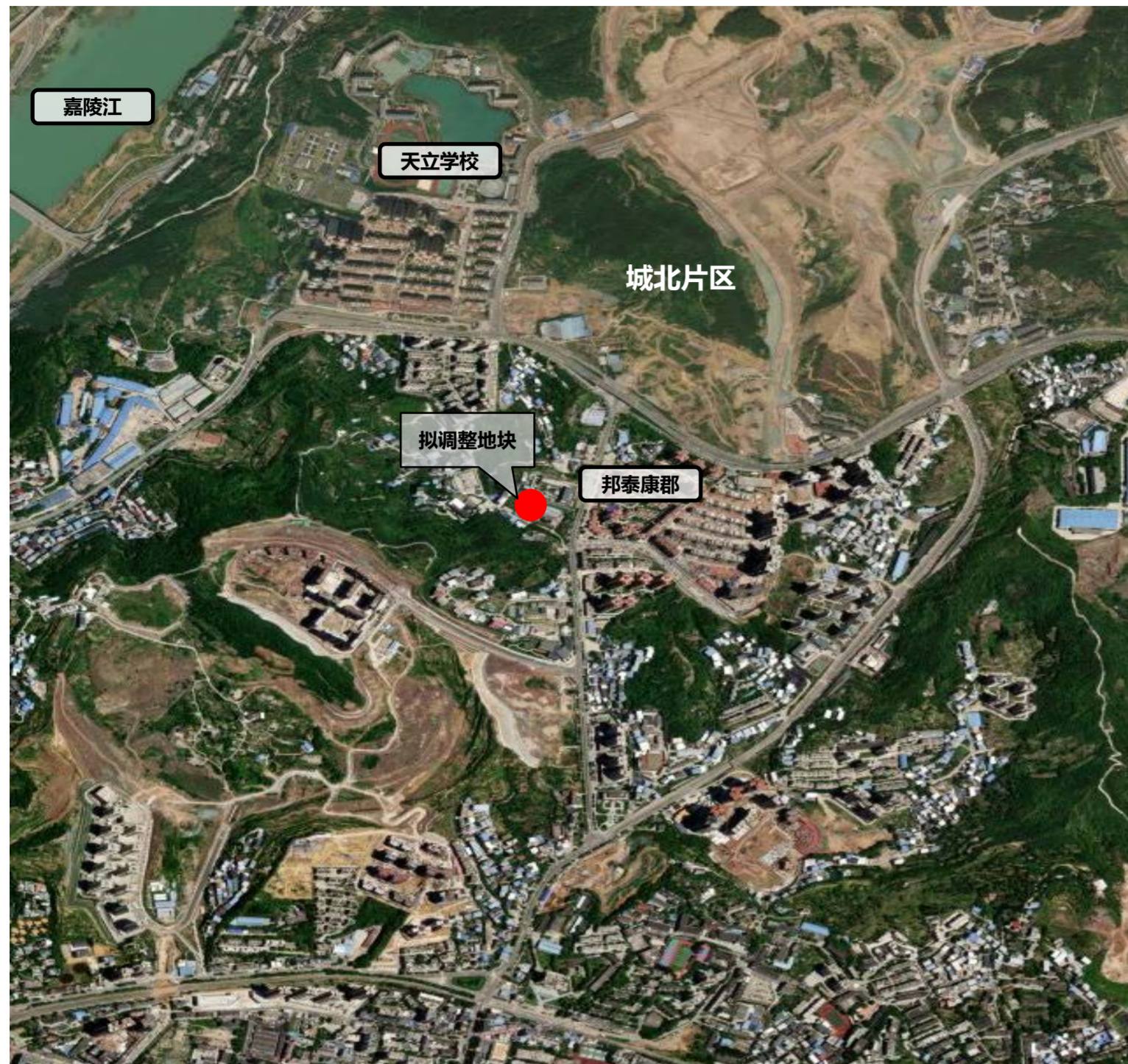
拟调整地块区位图