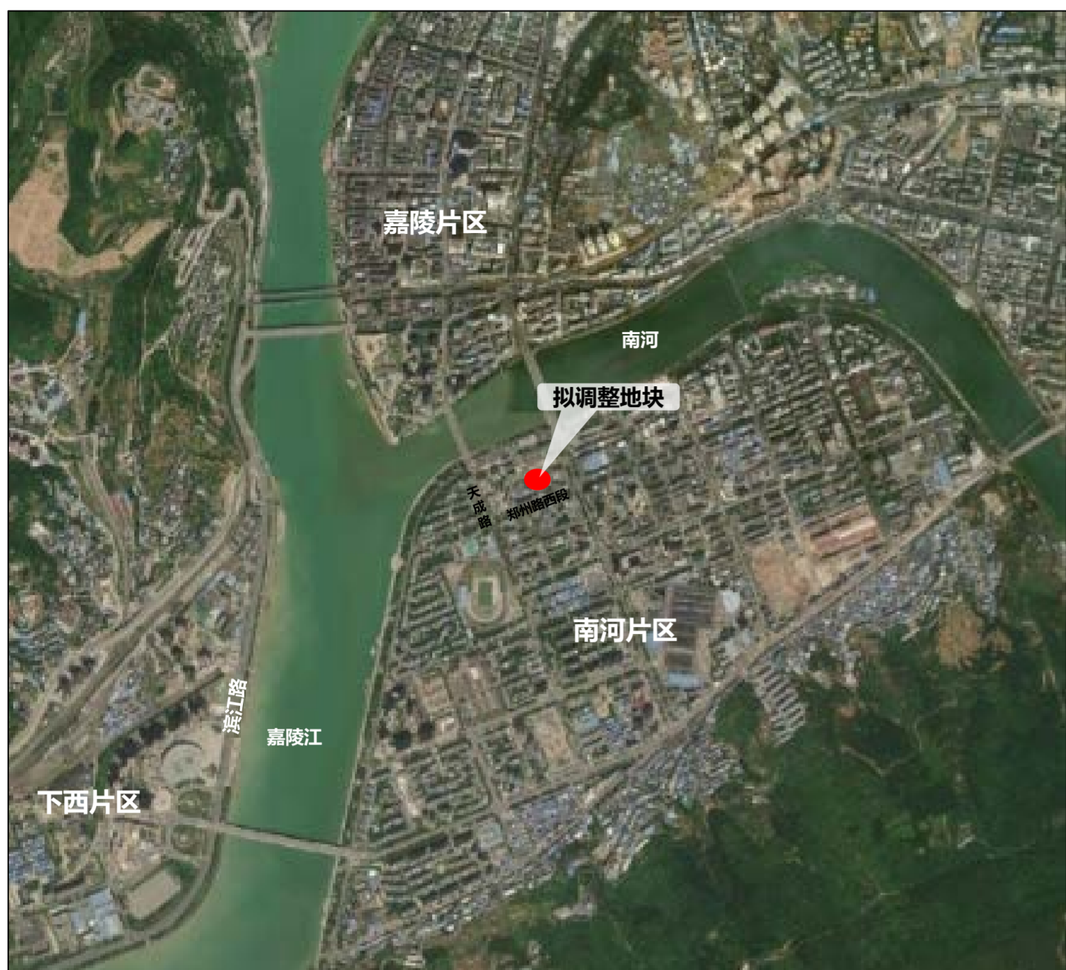
拟调整地块区位图