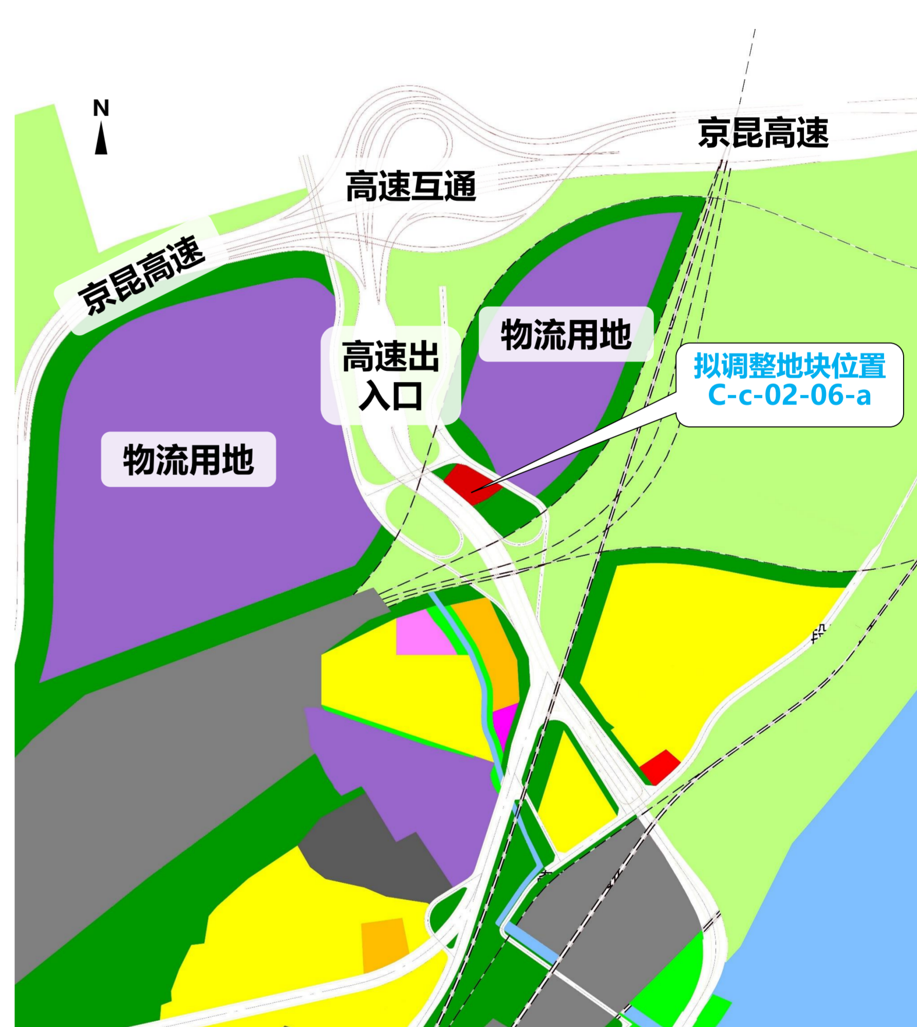
调整后用地规划指标