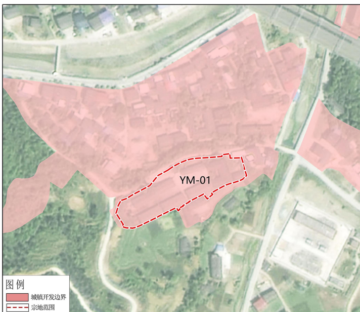
项目用地红线“三区三线”叠加图

高标准粮仓建设项目选址位于朝天区经济副中心羊木镇区，现状为羊木粮站，地块相对独立，西侧和南侧紧邻永久基本农田，北侧为现状居民用地，不适用于其他项目建设，地块紧邻兰渝铁路羊木火车站，且于1991年取得土地使用权证。《广元市国土空间总体规划（2021-2035）》确定该地块部分用地为住宅用地，根据宗地图及现场调查，范围内居住用地实际用途为粮站宿舍，属于羊木粮站仓储用地的一部分，需纳入储备库用地统一使用。