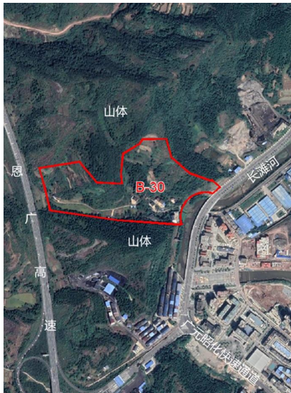
调整地块在卫星影像图中的位置