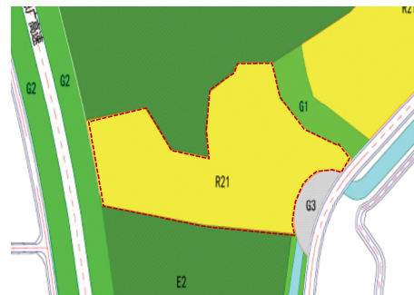
调整后用地布局规划图