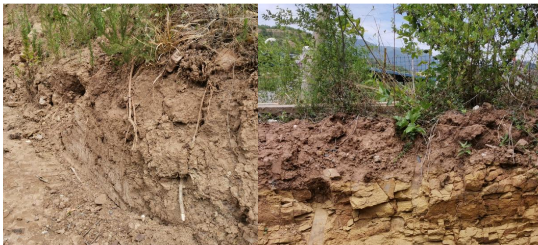
图 2-3 项目区土壤层

矿区范围内以园地、旱地、灌木林地、采矿用地为主。土壤成土母质中以中生代侏罗系粉砂质、黏土质页岩为主，除少数冷沙黄泥外，其它棕紫泥土、灰棕紫泥土、红紫泥土、红棕紫泥土、暗紫泥土。