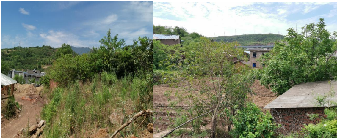
图 2-1 项目区地形